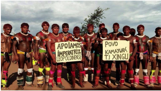
Índios da etnia Kamayurá, que fazem parte do Parque Indígena do Xingu, divulgaram foto em apoio à Imperatriz

Ruralistas ficaram incomodados e representantes políticos ligados ao setor reagiram. O senador ruralista Ronaldo Caiado (DEM-GO) afirmou que o samba-enredo "denigre a imagem do setor com calúnias generalizadas sobre a atuação da classe rural brasileira". Ele chegou a propor a abertura de uma CPI para intimidar a escola de samba.