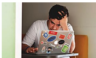
Síndrome de Burnout: quando o trabalho passa dos limites