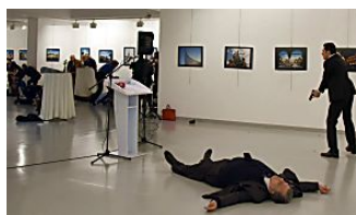
Putin: assassinato de embaixador mina relações russo-turcas e paz na Síria