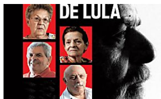
Como vivem os irmãos de Lula