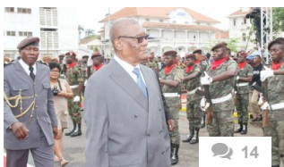
PR : Realiza primeira visita oficial a Portugal