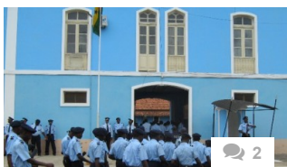
Domingos Papa confirmado como Comandante Geral da Polícia Nacional