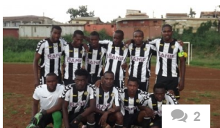
Ribeiro empata e não aproveita o deslize dos líderes