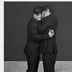
Marcelo Serrado e Marcos Veras se beijam em