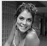
Ex-BBB e bailarina pernambucana Bella Maia