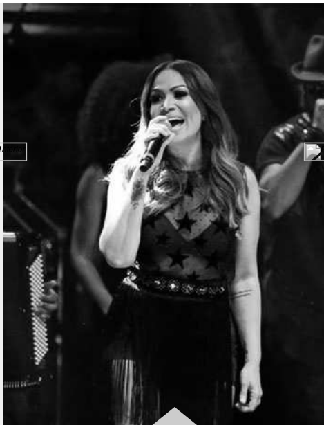
Solange Almeida fala sobre carreira solo