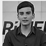
Sindicato emite nota de repúdio contra apresentador