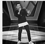
The Voice Brasil: Pernambuco detona