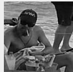
Leonardo Di Caprio curte praia em Trancoso

TAGS: polemica indigenas indios samba televisao jornalista record