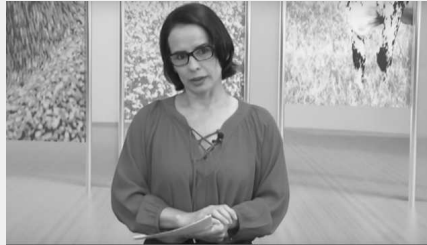
Jornalista defendeu que indígenas renunciassem as tecnologias e vivessem apenas do campo.

Publicado em: 10/01/2017 16:23 Atualizado em: