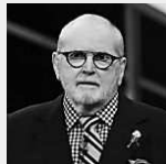
Jô Soares assina contrato com o SBT, diz jornal