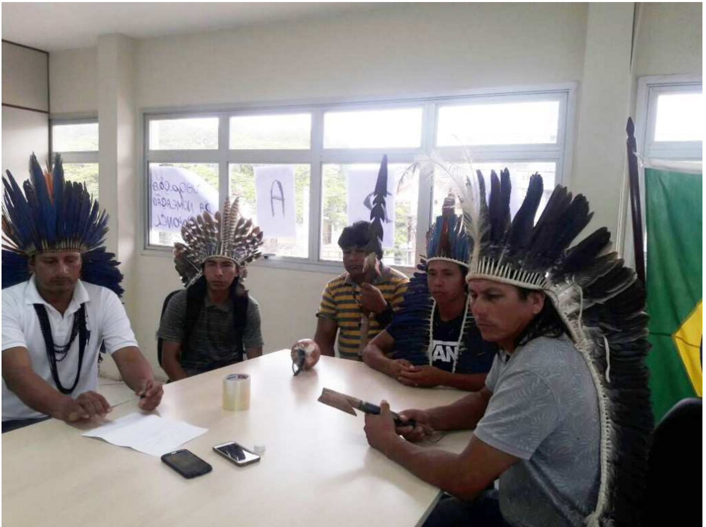
( http://amazoniareal.com.br/wp-content/uploads/2016/11/OCUPACAO-CR-FUNAI-EM-CAMPO-GRANDE-MS_-FOTO-EVELIN-HEKERE-3.jpg )

Indígenas ocuparam a Coordenação da Funai até que a nomeação do coronel seja revogada (Foto: Hekere Terenoe)