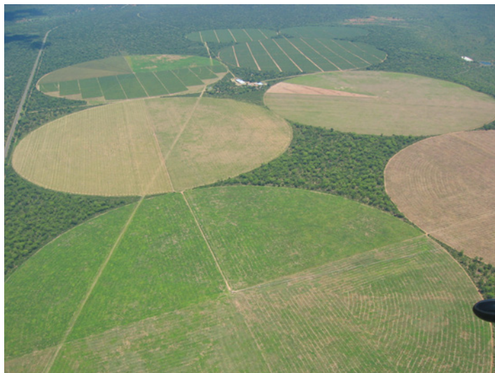
Plantations industrielles en Afrique Australe