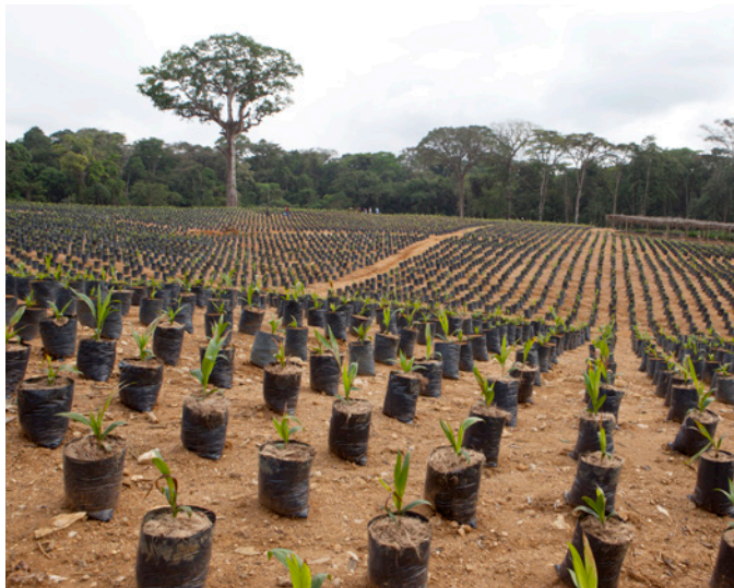
La plantation de palmiers à huile d'Herakles Farms au Cameroun