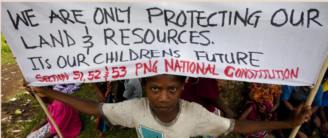
Manifestations contre l'accaparement des terres à Pomio, Papouasie Nouvelle Guinée

En rejetant les droits coutumiers communautaires, l'indicateur foncier de l'EBA impose un agenda néolibéral qui considère les droits de propriété privés individuels comme fonctionnellement supérieurs aux droits collectifs. Ce faisant, il nie la réalité de millions de personnes à travers le monde dont la subsistance est basée sur des droits collectifs et qui considèrent la terre, tout comme l'eau, comme un bien commun qui ne peut pas être privatisé.