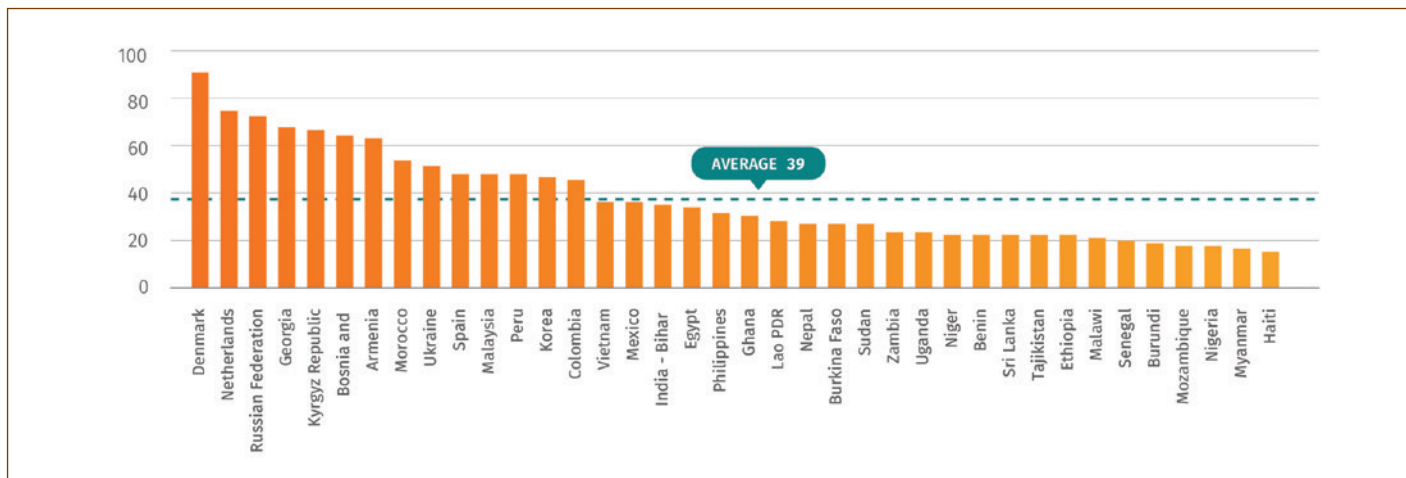
Figure 1: Notes par pays de l'indicateur foncier dans le rapport EBA 2017

optimale ».44 Pour que les pays pauvres améliorent leurs mauvaises notes en matière de gestion des terres publiques (voir Figure 1), ils doivent établir des mécanismes d'appel d'offres adéquats pour transférer les terres publiques au secteur privé et garantir un bon prix pour les terres vendues. En d'autres termes, les terres publiques doivent être vendues au plus offrant.45