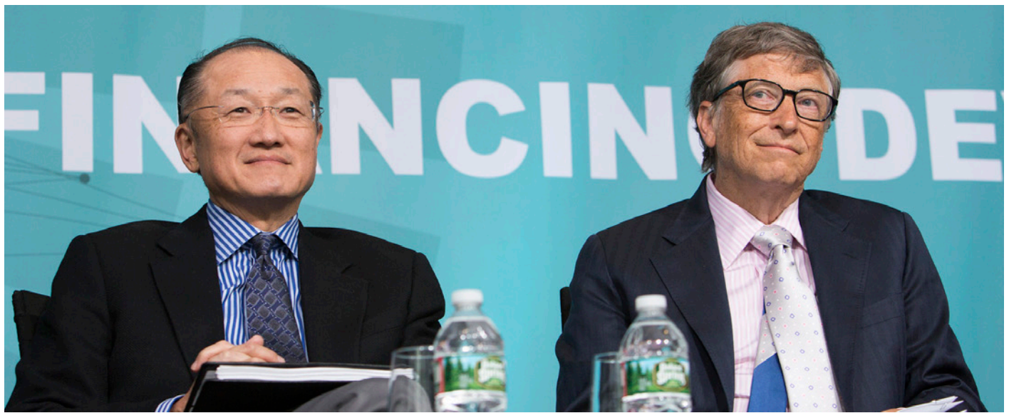
Bill Gates et le Président de la Banque mondiale Jim Yong Kim à la réunion de printemps de la Banque mondiale de 2016

la sécurité alimentaire et la nutrition, un partenariat entre des donateurs internationaux, dix pays africains et des multinationales, qui utilise les rapports Doing Business et EBA comme principaux indicateurs d'évaluation. 138 Une condition cruciale pour ce partenariat, et une condition importante pour pouvoir recevoir une aide, est que les pays africains s'engagent à réformer leurs politiques foncières pour les rendre plus attractifs pour les investisseurs étrangers. 139