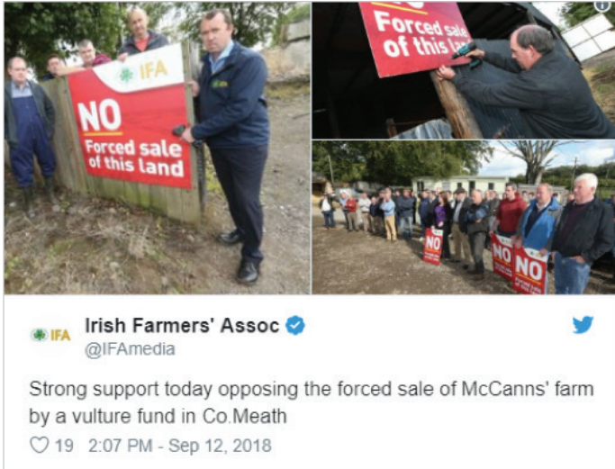
Tweet de l'Irish Farmers' Association

développement, où les agriculteurs sont extrêmement vulnérables aux chocs climatiques, reçoivent un soutien public limité, ne disposent pas d'assurance-récolte et où les prix agricoles sont généralement déréglementés et volatils. Lorsque les régimes fonciers permettent de telles ventes, les agriculteurs peuvent alors être contraints de vendre leurs terres au cours des années de mauvaises récoltes ou de bas prix. Cela s'est produit à grande échelle après la crise alimentaire de 2005 au Niger, alors qu'en une saison seulement, la faim avait obligé 8 à 14% des agriculteurs à vendre ou à hypothéquer leurs terres pour survivre. 55