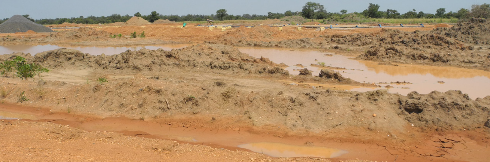
Terrain préparé par Saudi Star à Gambella, Ethiopie