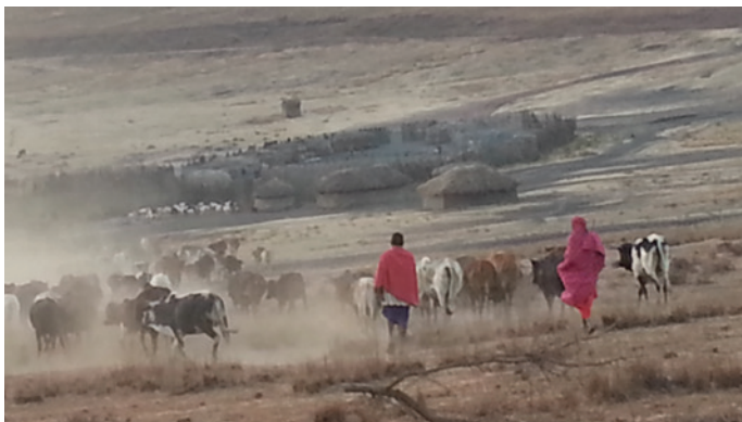
Pasteurs masaï à Loliondo, Tanzanie

Les terres dites publiques sont donc souvent des terres utilisées selon des arrangements coutumiers. Les ressources naturelles gérées de manière commune, telles que les terres agricoles, les eaux, les forêts et les savanes, sont essentielles à la subsistance de millions de pasteurs, pêcheurs et agriculteurs familiaux, et sont généralement