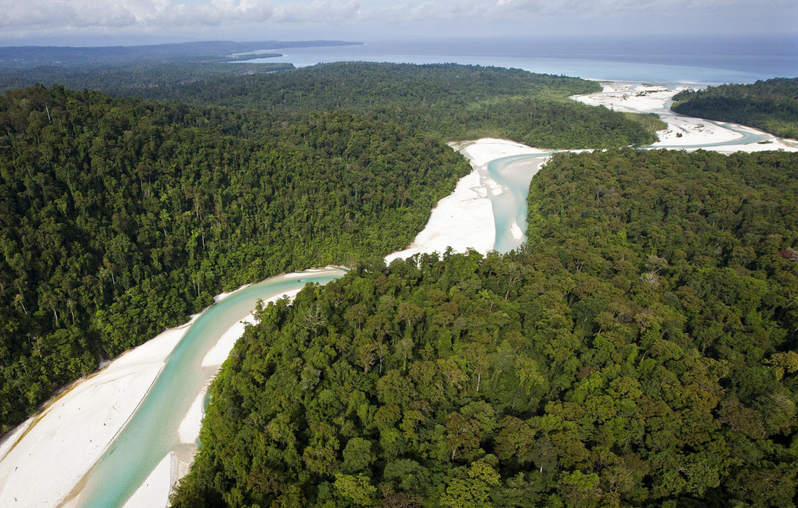
Qui va déterminer quelles sont les “zones à fort potentiel agricole” à privatiser? - Ici, la rivière Bairaman et les forêts environnantes en Papouasie Nouvelle Guinée

fois que les terres publiques seront transférées à un usage commercial, les investisseurs veilleront à ce que les terres « de valeur économique » (“ economically valuable land ”) soient utilisées avec « efficacité ». 99 La Banque ne fournit pas de définition des terres « de valeur économique » ni de ce qu'elle entend par « utilisation optimale » ou « utilisation efficace » des terres.