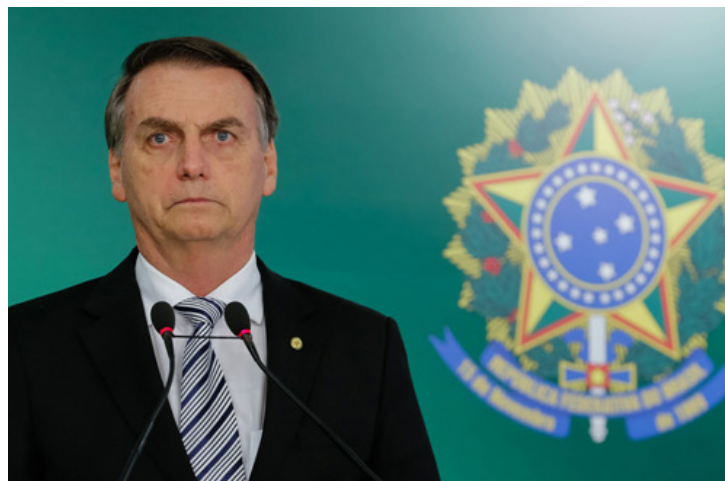
Le président brésilien Jair Bolsonaro

Le nouveau président d'extrême droite brésilien, Jair Bolsonaro, suit la doctrine de la Banque mondiale consistant à exploiter les terres « de valeur économique » dans le but déclaré d'abolir les terres autochtones protégées afin de développer l'élevage en ranch, l'agriculture industrielle et d'extraire des ressources. 100 Considérant que « là où il y a des terres autochtones, il y a des richesses », 101 Bolsonaro