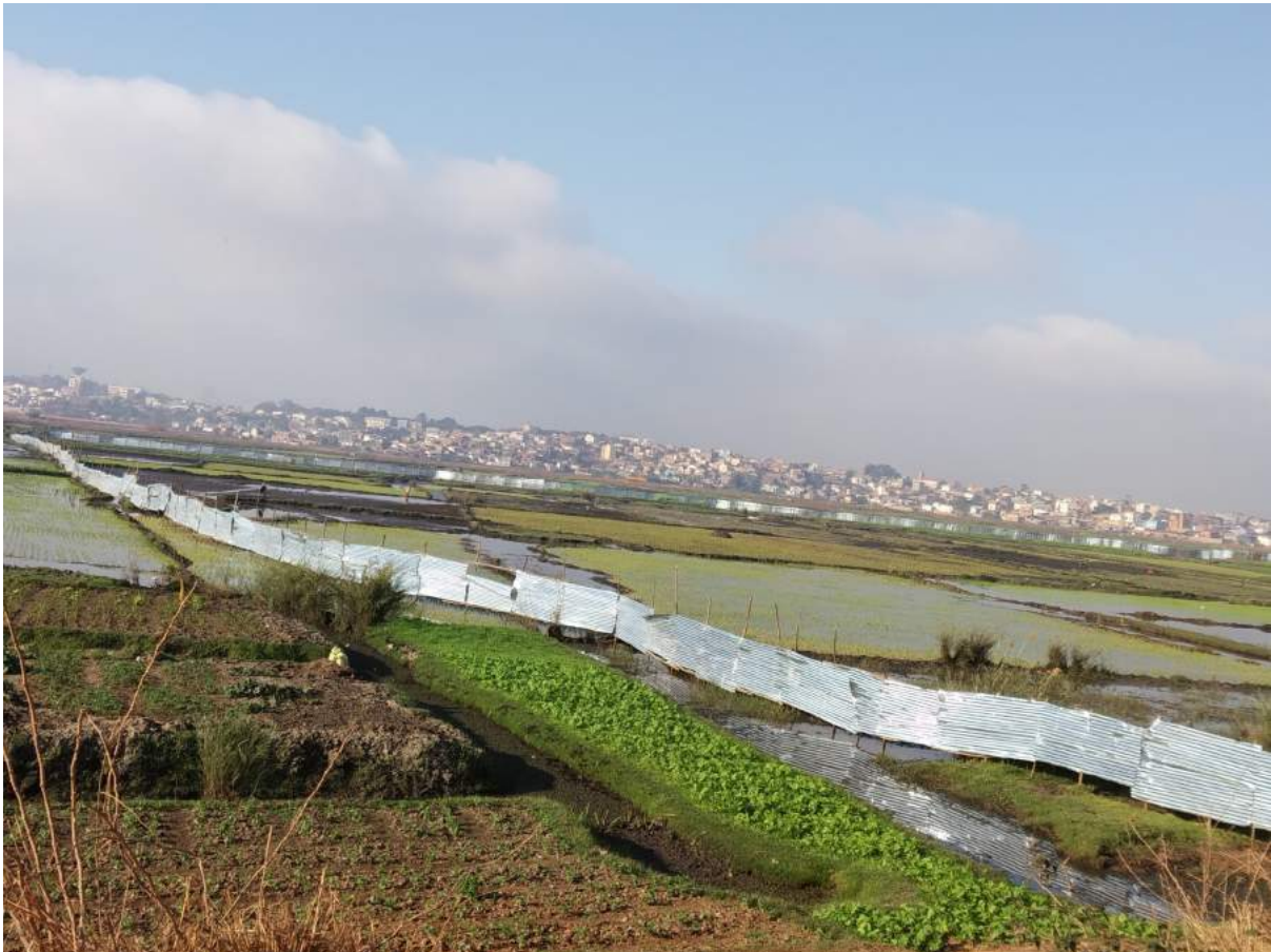
FIGURE 3: LA PLUPART DES TERRAINS DE CULTURES SONT DES PROPRIETES PRIVEES NON TITREES A MADAGASCAR, MISES EN VALEUR DEPUIS PLUSIEURS GENERATIONS

Concernant les pays d'Asie , les conditions et modalités d'accès à la terre dépend de l'histoire de ces pays. En Chine, pendant des décennies la terre était détenue par les collectifs paysans, ou par l'Etat. Des progrès ont été réalisés dans les zones urbaines, où la durée de la location à bail est maintenant normalement de 70 ans, mais dans les zones rurales, la propriété foncière collective se poursuit.