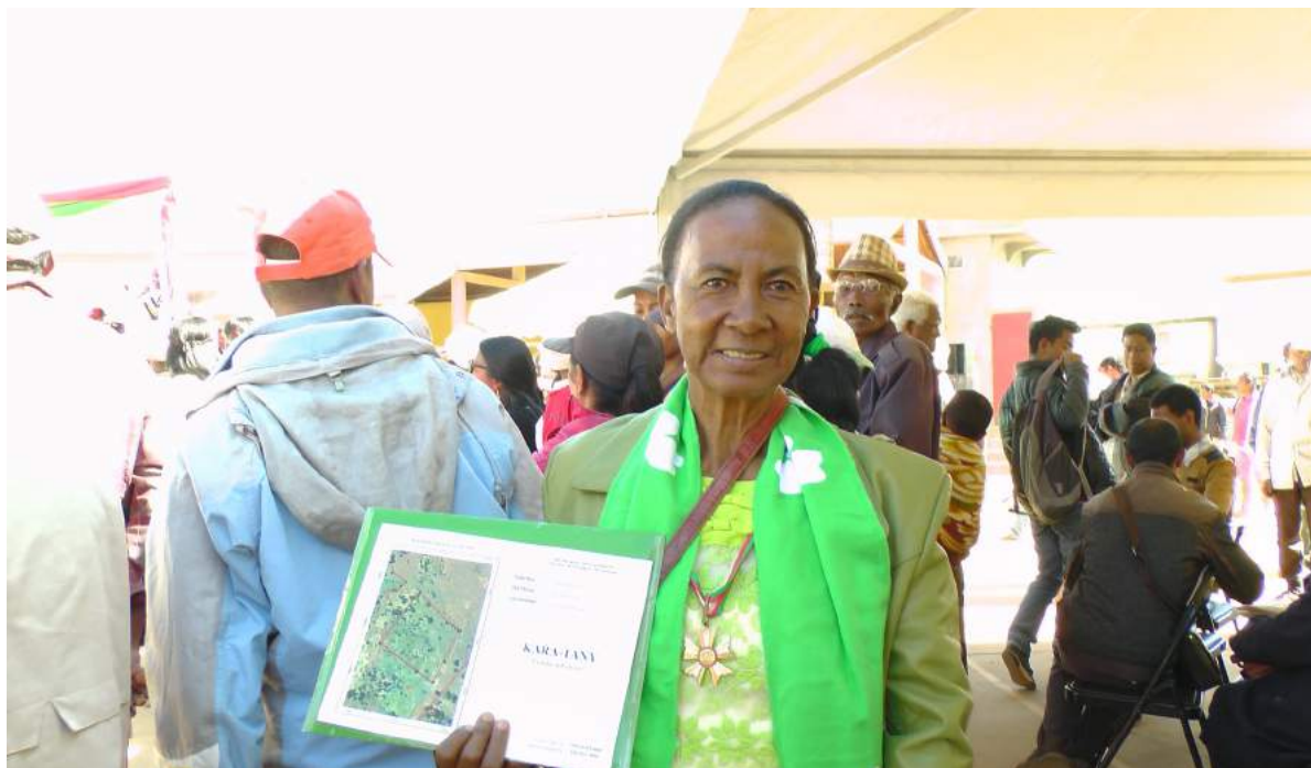
FIGURE 2: LE CERTIFICAT FONCIER, PREUVE DE RECONNAISSANCE DE DROIT DE PROPRIÉTÉ FONCIÈRE À LA SUITE DE LA RÉFORME DE LA POLITIQUE FONCIÈRE EN 2005

d'identifier d'une manière concertée les statuts des terres au niveau local pour faciliter et mettre en œuvre les outils de planification spatiale et d'aménagement du territoire. Pour la sécurisation foncière, cette nouvelle politique foncière de 2015 a mis en exergue l'amélioration du système de sécurisation foncière par le biais de la mise en synergie de la décentralisation et la déconcentration de la gestion foncière.