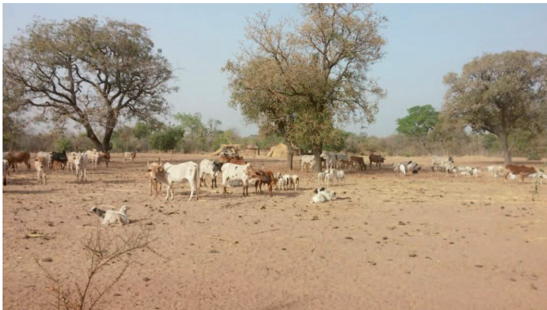
Photo 3 : Technologie du parcage des animaux au champ à Tiarako

À Bouéré, où les migrants constituent une proportion importante de la population, on constate qu'ils sont rarement associés aux formations sur la GDT, ce qui freine sérieusement l'adoption des technologies de GDT.