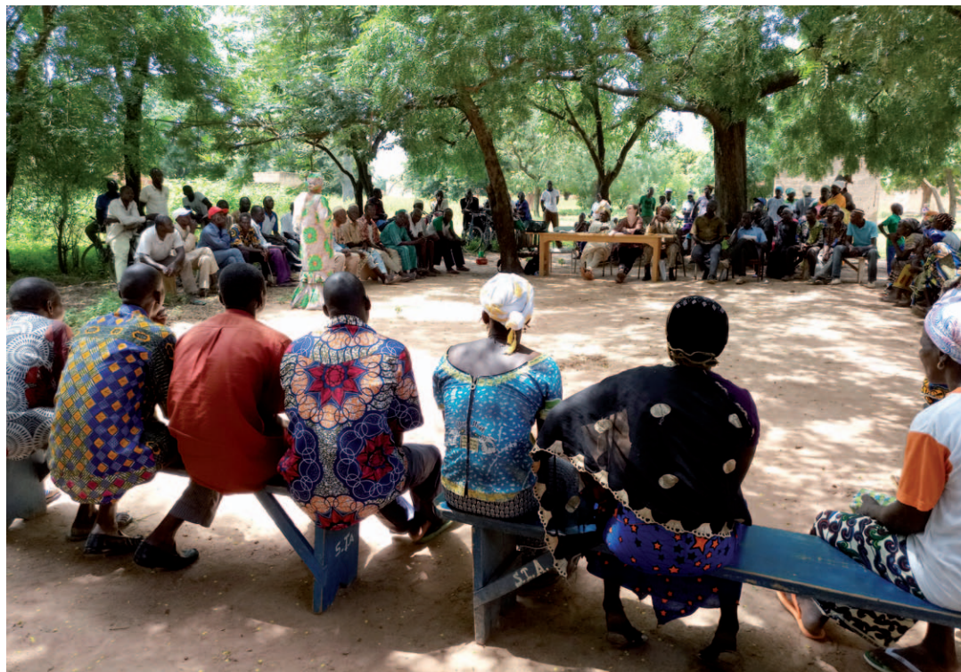
Photo 5 : Assemblée Générale à Tiarako. Discussion de la démarche et du calendrier pour lancer la recherche action avec les villageois

GDT et des capacités organisationnelles des groupements sera primordial pour une adoption durable des technologies de GDT. Le renforcement des capacités organisationnelles des groupements et leur bon fonctionnement peuvent constituer une solution au problème de la main d'œuvre insuffisante et peut fournir des opportunités de partenariat et d'accès aux crédits, aux intrants et aux équipements agricoles appropriés en GDT.