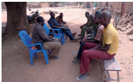
Photo 1 : Focus group avec des jeunes à Bouéré

À ces difficultés s'ajoutent celles liées à la disponibilité et à l'accès à la documentation. L'équipe n'a pas disposé de documents sur l'adoption des pratiques de GDT tant au niveau régional qu'au niveau de la zone couverte par l'étude. L'insuffisance de documentation n'a pas permis une bonne caractérisation des ménages agricoles. Aussi, nous n'avons pas pu disposer de statistiques agricoles sur les superficies culturales dans les deux villages. En l'absence de ces statistiques, nous n'avons pas pu comparer les données collectées au cours des focus groups et des entretiens individuels avec des données sur les productions quantitatives. Les données chiffrées rapportées dans le présent rapport sont donc des estimations fournies par les participants au cours des entretiens et des focus groupes.