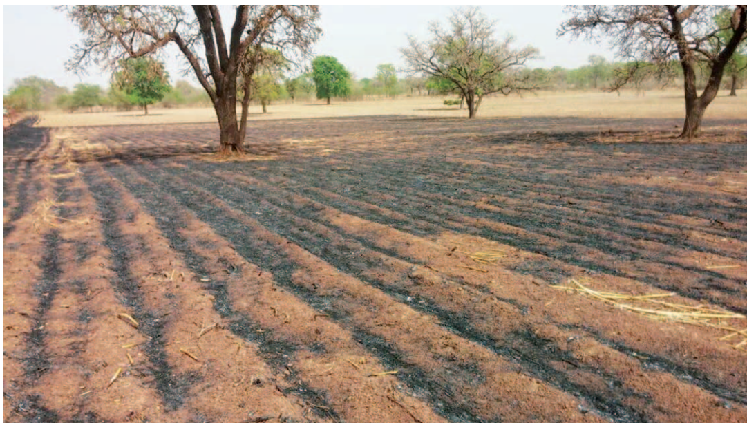
Photo 2 : Un champ cultivé en billon avec les résidus agricoles brûlés ; photo prise à Bouéré