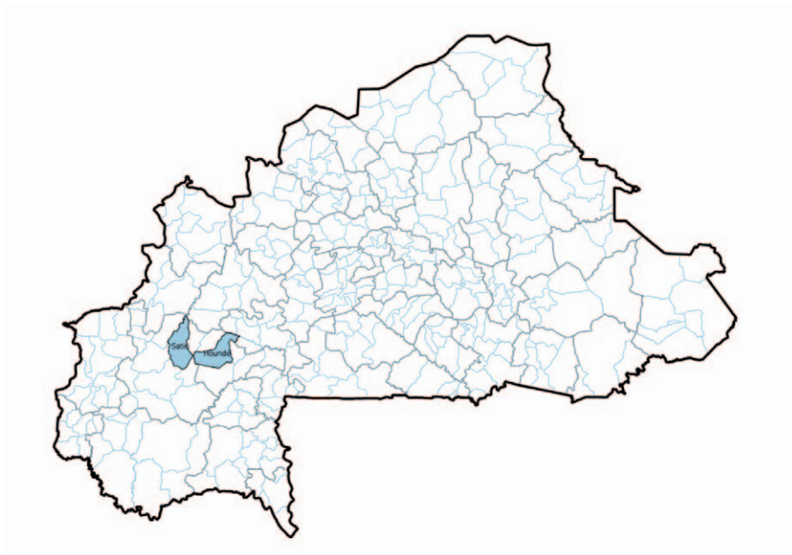
Figure 2 : Carte du Burkina Faso avec les communes de Satiri et de Houndé indiquées en bleu 4

Le village de Bouéré est situé à une vingtaine de km à l'ouest de la ville de Houndé. Sa population est estimée à environ 2000 habitants composée de Bwaba (groupe ethnique autochtone), de Mossé, de Dafing et de Peulh (tous migrants). Le village est caractérisé par une forte présence de migrants agricoles (environ 71% de la population), majoritairement des Mossé venus de la région du Nord du pays. L'organisation sociopolitique repose sur un chef de village et un chef de terre auxquels s'ajoutent des chefs de lignage (chez les autochtones) et des leaders de quartier chez les migrants.